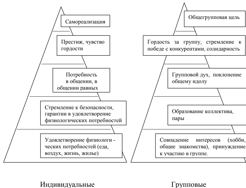
Рис 1 Иерархия мотивов.

Альтруизм предусматривает получение удовольствия от заботы о благополучии окружающих.